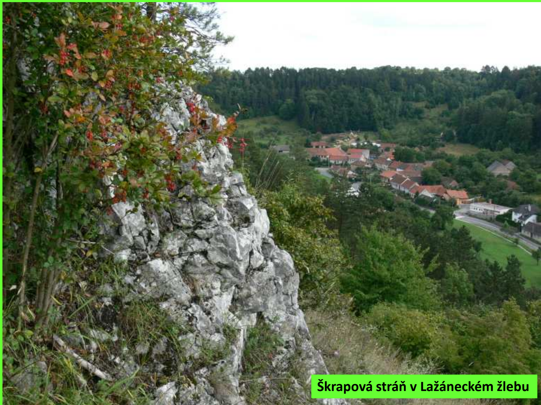
Škrapová stráň v Lažáneckém žlebu