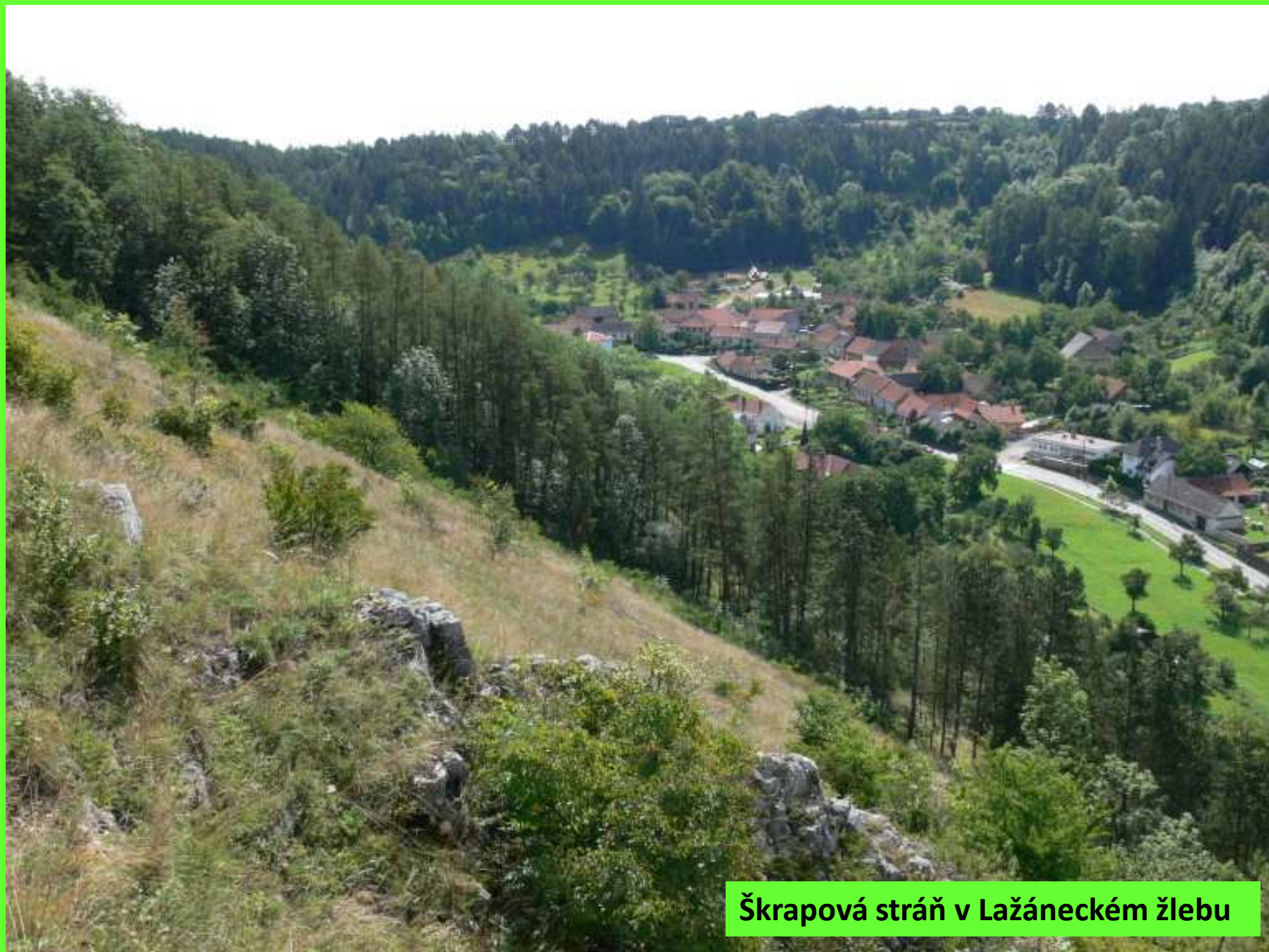
Škrapová stráň v Lázněckém žlebu